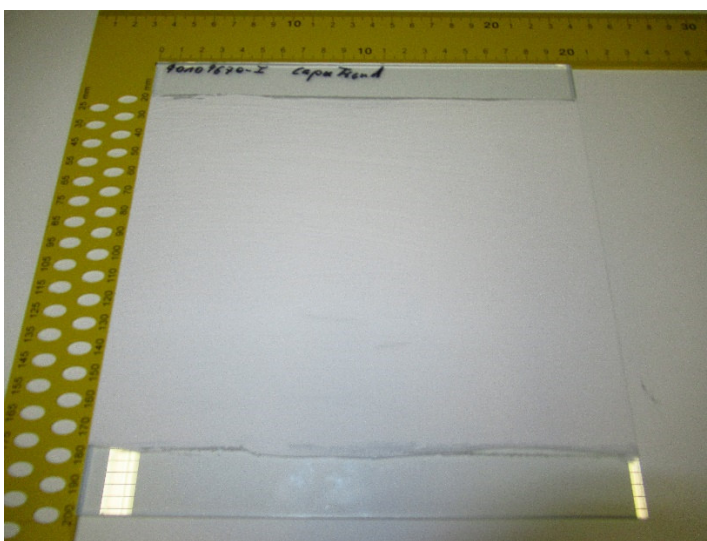
Abbildung 1: Prüfkörper