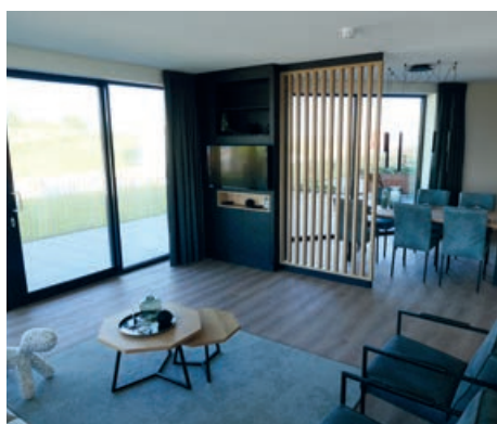
Een van de afgewerkte en inmiddels bewoonde appartementen