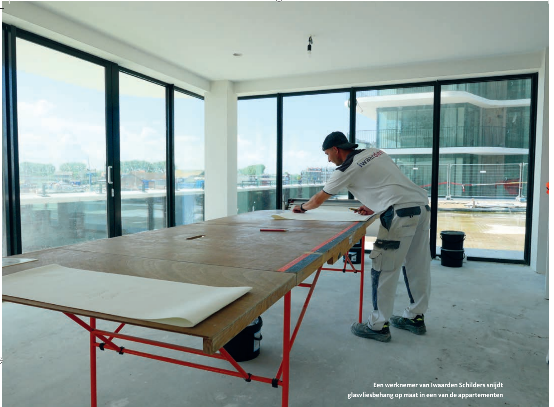
Een werknemer van Iwaarden Schilders snijdt glasvliesbehang op maat in een van de appartementen