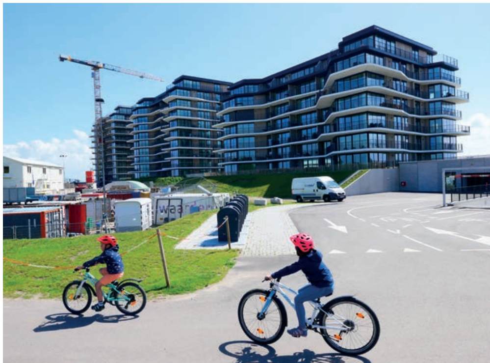
Op de kade in Breskens waar boten vroeger hun lading losten, zijn nu drie gebouwen met in totaal 159 appartementen voor wonen en recreëren verrezen