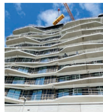
Vanuit een hangbak voeren twee schilders schilderwerk uit