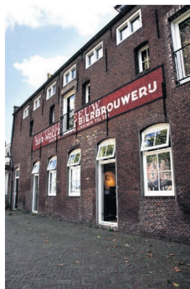
De muurreclame prijkt weer in volle glorie. Een opdracht die naar meer smaakt voor Bouman

Probleem: de specifieke kleur wit die Bouman nodig had, bleek niet te bestaan in het kleurengamma van Caparol. ‘Maar gelukkig ben ik goed geholpen door de technische man van Caparol, Silvester Spaansen. Hij zorgde ervoor dat ik alle benodigheden op tijd had en heeft ook een minerale witte verf gevonden waarmee ik de letters kon terugbrengen. Beide teksten zijn niet heel ‘hard’; je moet wel kunnen zien dat het oud en vergaan is. Tenminste, die uitstraling. Om het verschil tussen beide reclameteksten te laten zien, is die van de mouterij iets grijzer en transparanter dan de voorste van de brouwerij.’